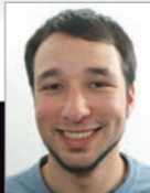
Bilder: Daniela Frank, Heiko Röbbke