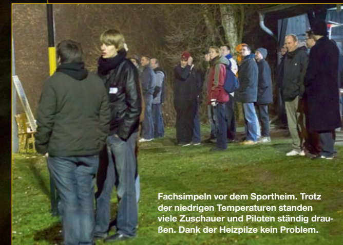
Fachsimpeln vor dem Sportheim. Trotz der niedrigen Temperaturen standen viele Zuschauer und Piloten ständig draußen. Dank der Heizpilze kein Problem.

Da seine Mutter ohnehin für den Gastronomiebereich des Sportheims zuständig ist, war das Treffen schnell beschlossene Sache.