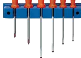
66 7000 / 7050_4/2