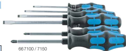
66 7100 / 7150

Ausführung: Heft mit drehbarer Zentrierkappe und Schnelldrehzone.