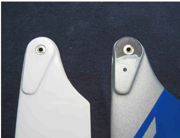
Blattschmied Xtro 240mm Draufsicht Links: Unbearbeitetes Original Rotorblatt Rechts: Funktionsunfähig durch Nachbearbeit an der der Blattwurzel – konisch geschliffen