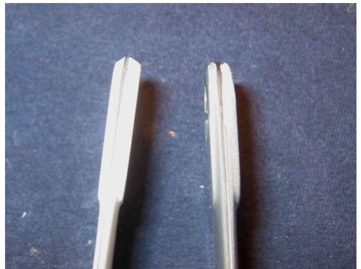
Blattschmied Xtro 240 mm Seitenansicht Links: Unbearbeitetes Original Rotorblatt Rechts: Funktionsunfähig durch Nacharbeit der Blattwurzel - konisch geschliffen