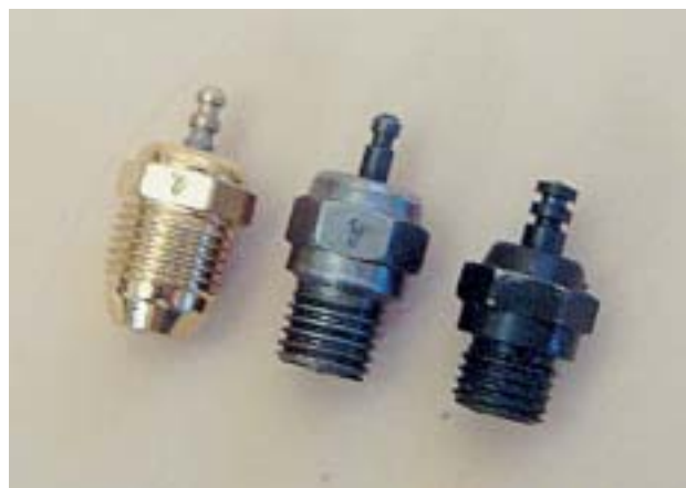
Die drei im RC-Car-Bereich üblichen Glühkerzen-Bauformen (v.l.n.r.): konische Kerze (auch als Turbo-Kerze bezeichnet), Kerze mit langem Gewinde und die Kerze mit kurzem Gewinde.