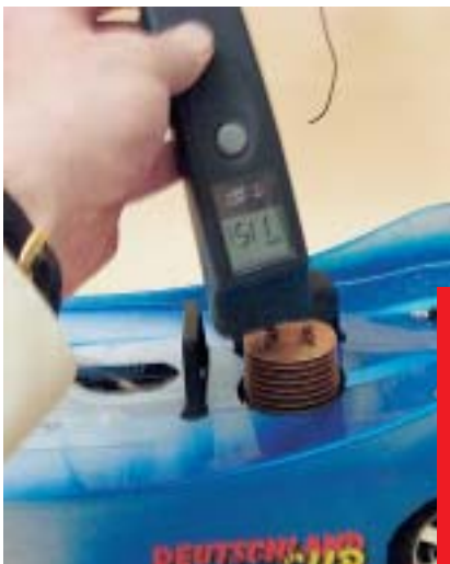
Messen der Motortemperatur mit einem Infrarot-Thermometer: 115 °C, noch im grünen Bereich.

Die letzte Möglichkeit der Abhilfe ist, die Kompression des Motors etwas zu vermindern. Von fast allen Herstellern gibt es sehr dünne Zylinderkopfdichtungen und