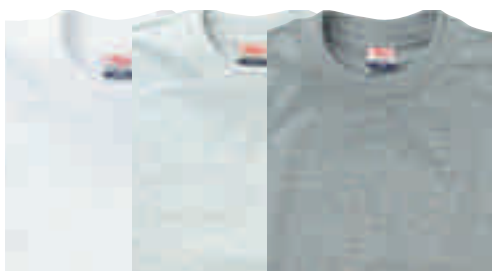
Weiss* Asch* Aschgrau