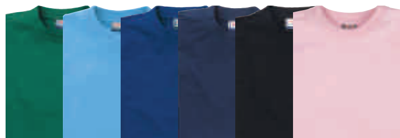
Grün Himmelblau Blau Marine Schwarz Hellpink