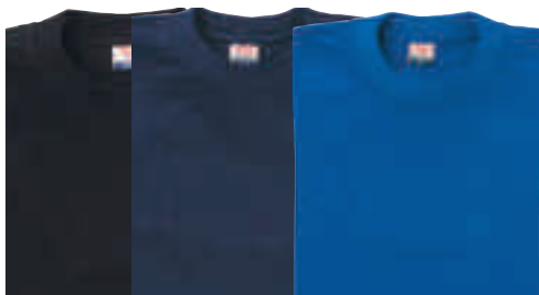
Schwarz* Marine* Royal*