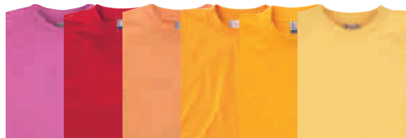
Himbeere Rot Orange Mandarine Gelb Honiggelb