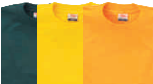
Dunkelgrün Limone Gelb