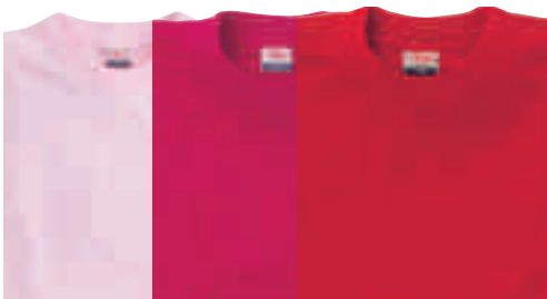
Hellpink Kirsche Rot*