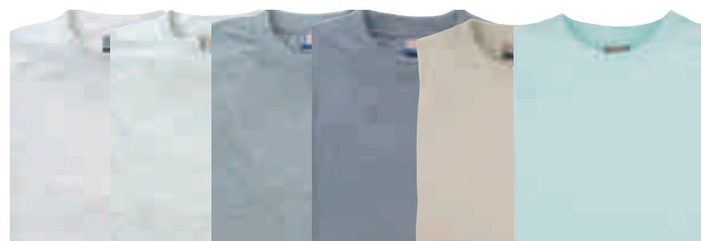
Weiss Asch Dunkel-aschgrau Grau Sand Eisblau